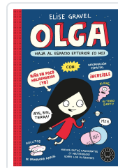
OLGA VIAJA AL ESPACIO EXTERIOR (O NO) (NE) GRAVEL, ELISE