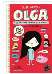
OLGA Y LA EXTRAÑA CRIATURA SIN NOMBRE (NE) GRAVEL, ELISE