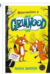
BIENVENIDOS A GRIMWOOD SHIREEN, NADIA