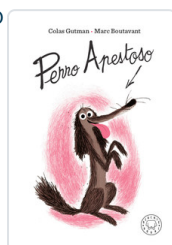
PERRO APESTOSO GUTMAN, COLAS