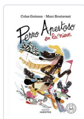
PERRO APESTOSO EN LA NIEVE GUTMAN, COLAS