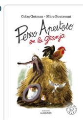
PERRO APESTOSO EN LA GRANJA GUTMAN, COLAS