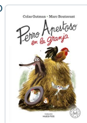
PERRO APESTOSO EN LA GRANJA GUTMAN, COLAS