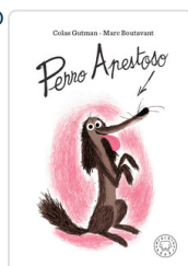
PERRO APESTOSO GUTMAN, COLAS