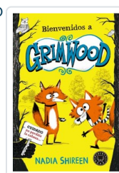
BIENVENIDOS A GRIMWOOD SHIREEN, NADIA