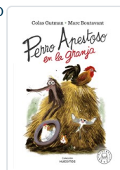
PERRO APESTOSO EN LA GRANJA GUTMAN, COLAS