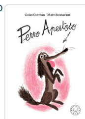
PERRO APESTOSO GUTMAN, COLAS