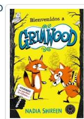
BIENVENIDOS A GRIMWOOD SHIREEN, NADIA