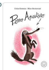
PERRO APESTOSO GUTMAN, COLAS