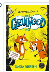
BIENVENIDOS A GRIMWOOD SHIREEN, NADIA