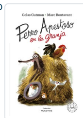
PERRO APESTOSO EN LA GRANJA GUTMAN, COLAS