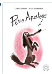
PERRO APESTOSO GUTMAN, COLAS