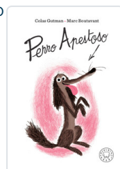
PERRO APESTOSO GUTMAN, COLAS