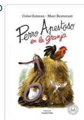
PERRO APESTOSO EN LA GRANJA GUTMAN, COLAS