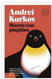
MUERTE CON PINGUINO (BLACKIE BOLSILLO) KURKOV, ANDREI