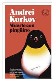
MUERTE CON PINGÜINO (BLACKIE BOLSILLO) KURKOV, ANDREI