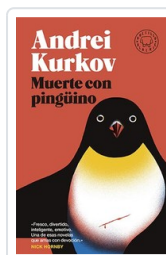
MUERTE CON PINGUINO (BLACKIE BOLSILLO) KURKOV, ANDREI