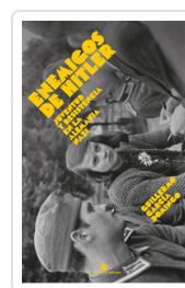
ENEMIGOS DE HITLER. JUVENTUD Y RESISTENCIA EN LA ALEMANIA N GARCIA DOMINGO, GUILLERMO