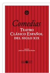
COMEDIAS. TEATRO CLÁSICO ESPAÑOL SIGLO XIX, 1 GONZALEZ SUBIAS, JOSE LUIS