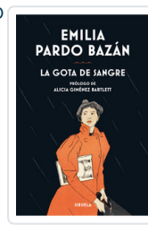
GOTA DE SANGRE, LA PARDO BAZAN, EMILIA