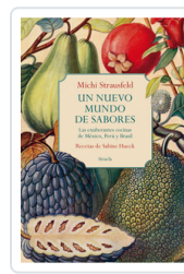
UN NUEVO MUNDO DE SABORES. EXUBERANTES COCINAS MEXICO, PERU STRAUSFELD, MICHI/ HUECK, SABINE