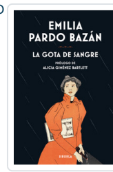
GOTA DE SANGRE, LA PARDO BAZAN, EMILIA