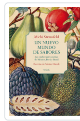
UN NUEVO MUNDO DE SABORES. EXUBERANTES COCINAS MEXICO, PERU STRAUSFELD, MISHI/ HUECK, SABINE