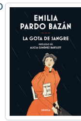
GOTA DE SANGRE, LA PARDO BAZAN, EMILIA