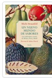
UN NUEVO MUNDO DE SABORES. EXUBERANTES COCINAS MEXICO, PERU STRAUSFELD, MICHI/ HUECK, SABINE