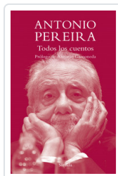
TODOS LOS CUENTOS PEREIRA, ANTONIO