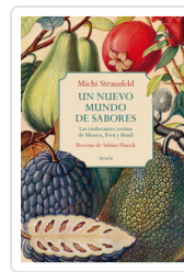
UN NUEVO MUNDO DE SABORES. EXUBERANTES COCINAS MEXICO, PERU STRAUSFELD, MICH/ HUECK, SABINE