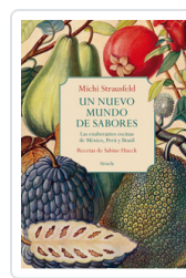
UN NUEVO MUNDO DE SABORES. EXUBERANTES COCINAS MEXICO, PERU STRAUSFELD, MICH/ HUECK, SABINE