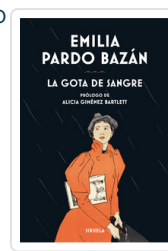
GOTA DE SANGRE, LA PARDO BAZAN, EMILIA