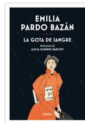
GOTA DE SANGRE, LA PARDO BAZAN, EMILIA