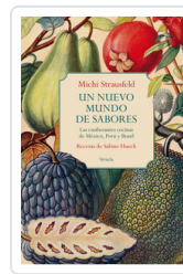
UN NUEVO MUNDO DE SABORES. EXUBERANTES COCINAS MEXICO, PERU STRAUSFELD, MICH/ HUECK, SABINE