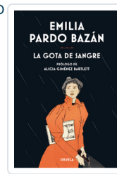
GOTA DE SANGRE, LA PARDO BAZAN, EMILIA