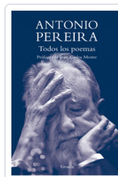
TODOS LOS POEMAS PEREIRA, ANTONIO