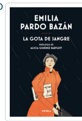
GOTA DE SANGRE, LA PARDO BAZAN, EMILIA