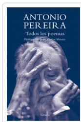
TODOS LOS POEMAS PEREIRA, ANTONIO