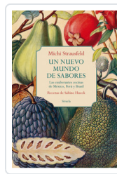
UN NUEVO MUNDO DE SABORES. EXUBERANTES COCINAS MEXICO, PERU STRAUSFELD, MICHI/ HUECK, SABINE