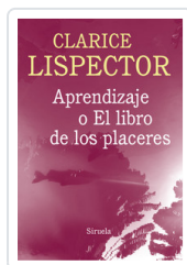
APRENDIZAJE O EL LIBRO DE LOS PLACERES LISPECTOR, CLARICE