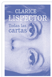
TODAS LAS CARTAS LISPECTOR, CLARICE