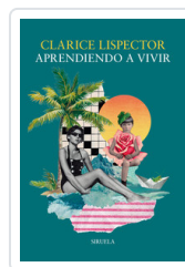
APRENDIENDO A VIVIR LISPECTOR, CLARICE