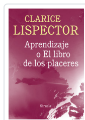
APRENDIZAJE O EL LIBRO DE LOS PLACERES LISPECTOR, CLARICE