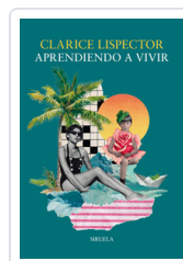
APRENDIENDO A VIVIR LISPECTOR, CLARICE