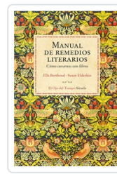
MANUAL DE REMEDIOS LITERARIOS (R) BERTHOUD, ELLA/ ELDERKIN, SUSAN