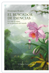
BUSCADOR DE ESENCIAS. VIAJE AL ORIGEN DE PERFUMES MUNDO ROQUES, DOMINIQUE