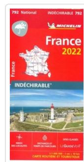
MAPA NATIONAL FRANCE 2022 - ALTA RESISTENCIA AA.VV.