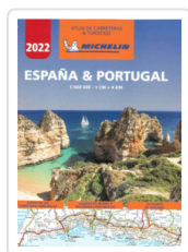
ATLAS ESPAÑA & PORTUGAL A4 (04460) AA.VV.