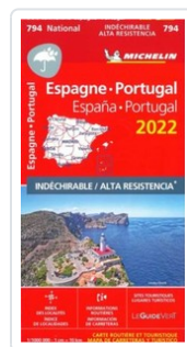
MAPA NATIONAL ESPAÑA, PORTUGAL 2022 - ALTA RESISTENCIA AA.VV.