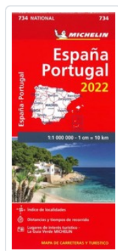
MAPA NATIONAL ESPAÑA, PORTUGAL N° 734 (2022) AA.VV.