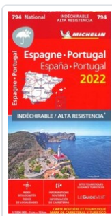
MAPA NATIONAL ESPAÑA, PORTUGAL 2022 - ALTA RESISTENCIA AA.VV.