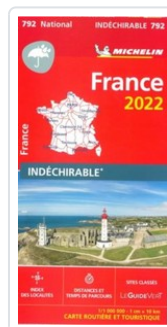
MAPA NATIONAL FRANCE 2022 - ALTA RESISTENCIA AA.VV.