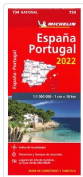
MAPA NATIONAL ESPAÑA, PORTUGAL Nº 734 (2022) AA.VV.