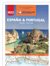
ATLAS ESPAÑA & PORTUGAL A4 (04460) AA.VV.