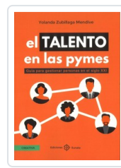
TALENTO EN LAS PYMES ZUBILLAGA MENDIVE, YOLANDA