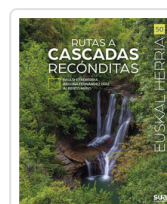
RUTAS A CASCADAS RECONDITAS MURO PEREG, ALBERTO / FERNANDEZ DIAZ, BE