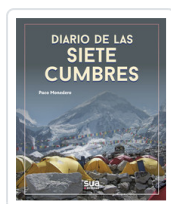
DIARIO DE LAS 7 CUMBRES MONEDERO, PACO