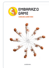
EMBARAZO GAME LUZON TORO, CAROLINA