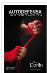
AUTODEFENSA DORLIN, ELSA