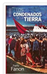
CONDENADOS DE LA TIERRA FANON, FRANTZ