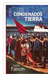
CONDENADOS DE LA TIERRA FANON, FRANTZ