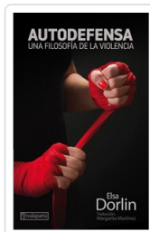
AUTODEFENSA DORLIN, ELSA