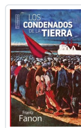
CONDENADOS DE LA TIERRA FANON, FRANTZ