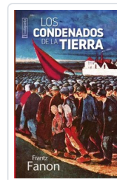
CONDENADOS DE LA TIERRA FANON, FRANTZ