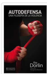
AUTODEFENSA DÖRLIN, ELSA