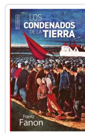
CONDENADOS DE LA TIERRA FANON, FRANTZ