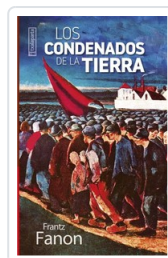
CONDENADOS DE LA TIERRA FANON, FRANTZ