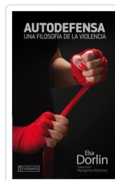
AUTODEFENSA DORLIN, ELSA