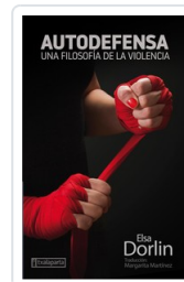
AUTODEFENSA DORLIN, ELSA