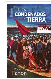
CONDENADOS DE LA TIERRA FANON, FRANZ