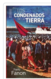
CONDENADOS DE LA TIERRA FANON, FRANTZ