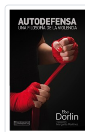
AUTODEFENSA DORLIN, ELSA