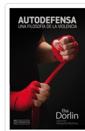
AUTODEFENSA DORLIN, ELSA