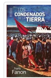
CONDENADOS DE LA TIERRA FANON, FRANTZ