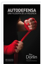
AUTODEFENSA DORLIN, ELSA