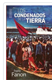
CONDENADOS DE LA TIERRA FANON, FRANTZ