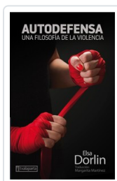
AUTODEFENSA DORLIN, ELSA