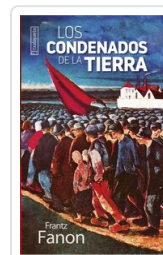
CONDENADOS DE LA TIERRA FANON, FRANTZ