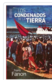
CONDENADOS DE LA TIERRA FANON, FRANTZ