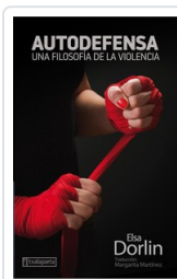
AUTODEFENSA DORLIN, ELSA