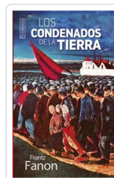
CONDENADOS DE LA TIERRA FANON, FRANTZ