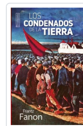
CONDENADOS DE LA TIERRA FANON, FRANTZ