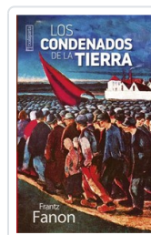
CONDENADOS DE LA TIERRA FANON, FRANTZ