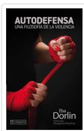
AUTODEFENSA DORLIN, ELSA