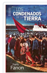
CONDENADOS DE LA TIERRA FANON, FRANTZ