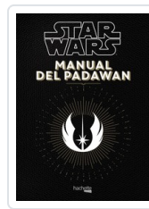
MANUAL DEL PADAWAN NICOLAS BEAUJOUAN