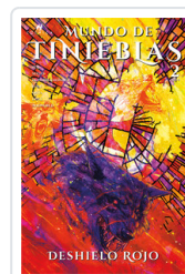
MUNDO DE TINIEBLAS, 2 DESHIELO ROJO AA.VV.