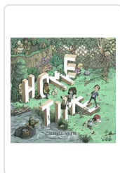
HOME TIME, 1 WHYTE, CAMPBELL