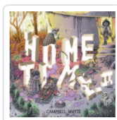
HOME TIME, 2 MAS ALLA DEL MURO WHYTE, CAMPBELL