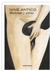
MADONAS Y PUTAS ANTICO, NINE