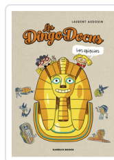
DINGO DOCUS. LOS EGIPCIOS AUDOIN, LAURENT