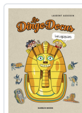
DINGO DOCUS. LOS EGIPCOS AUDOIN, LAURENT