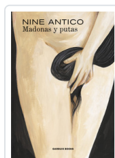
MADONAS Y PUTAS ANTICO, NINE