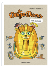
DINGO DOCUS. LOS EGIPCIOS AUDOIN, LAURENT