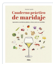
CUADERNO PRÁCTICO DE MARIDAJE. APRENDE A COMBINAR PLATOS... AYALA COTS, XAVIER