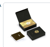
CANDY. LOS POSTRES DE ELBARRI GIL, DAVID/ ADRIÀ, ALBERT