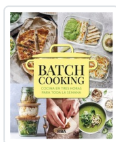
BATCH COOKING AA.VV.