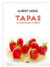
TAPAS. LA COCINA DEL TICKETS ADRIÀ, ALBERT