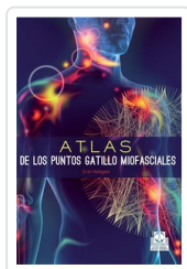
ATLAS DE LOS PUNTOS GATILLO MIOFASIALES HEBGEN, ERIC