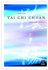
TAI-CHI CHUAN. LOS EJERCICIOS BASICOS YEN-LING, SHING