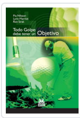
TODO GOLPE DEBE TENER UN OBJETIVO NILSSON/ MARRIOT/ SIRAK