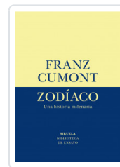
ZODIACO. UNA HISTORIA MILENARIA CUMONT, FRANZ