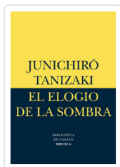
ELOGIO DE LA SOMBRA, EL TANIZAKI, JUNICHIRO