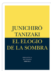
ELOGIO DE LA SOMBRA, EL TANIZAKI, JUNICHIRO