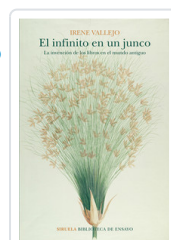
INFINITO EN UN JUNCO. INVENCION DE LIBROS EN MUNDO ANTIGUO VALLEJO, IRENE