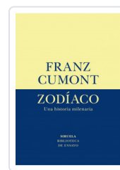
ZODIACO. UNA HISTORIA MILENARIA CUMONT, FRANZ