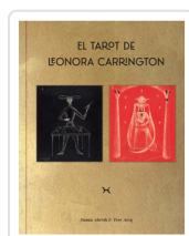
TAROT DE LEONORA CARRINGTON ABERTH, SUSAN/ ARCQ, TERE