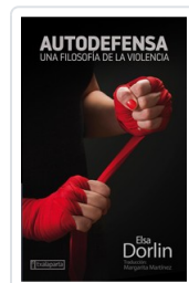
AUTODEFENSA DORLIN, ELSA