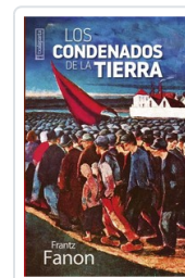
CONDENADOS DE LA TIERRA FANON, FRANTZ